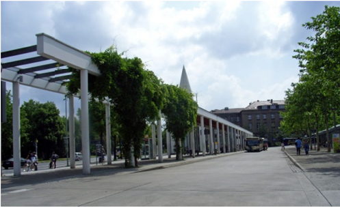
Zentraler Omnibusbahnhof (ZOB) / Haltestelle Zoologisches Institut am Hauptbahnhof in Göttingen